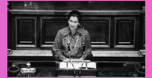
1974 La loi Veil dépénalise l'interruption volontaire de grossesse.