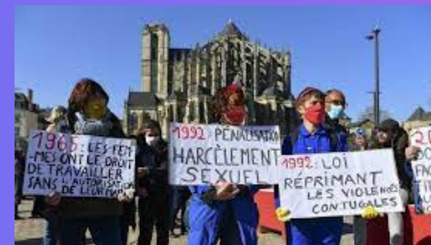
1992 Le harcèlement sexuel au travail est sanctionné