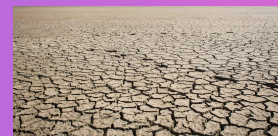
2186 Les inégalités se réduisent tellement lentement, qu'à ce rythme, on atteindra l'égalité salariale en 2186 seulement !