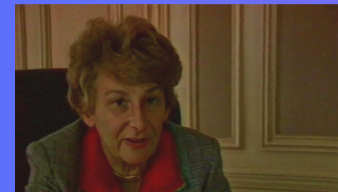
1983 La loi Roudy instaure l'égalité professionnelle femmes hommes.