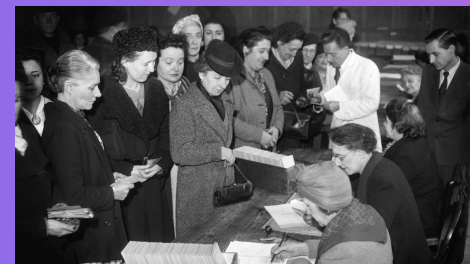
1944 Les femmes obtiennent le droit de vote