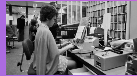
1965 Les femmes mariées sont autorisées à travailler, à ouvrir un compte et à signer des chèques sans l'autorisation de leur mari