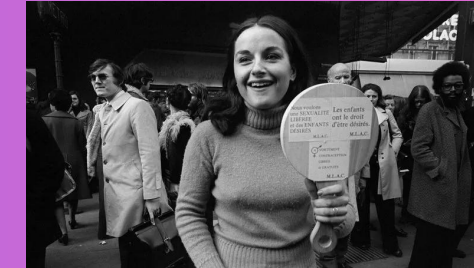
1967 La loi Neuwirth autorise la contraception.