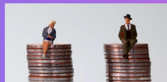
2006 La loi impose des négociations sur des mesures de suppression des écarts de rémunérations