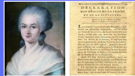
1791 Olympe de Gouges envoie la Déclaration des droits des femmes et de la citoyenne à Marie-Antoinette